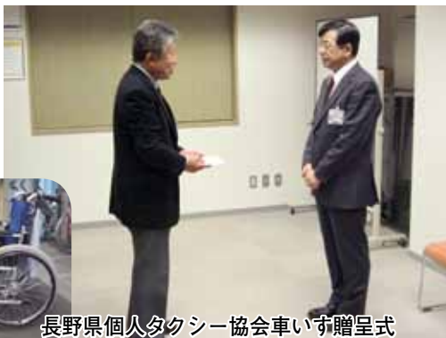
長野県個人タクシー協会車いす贈呈式