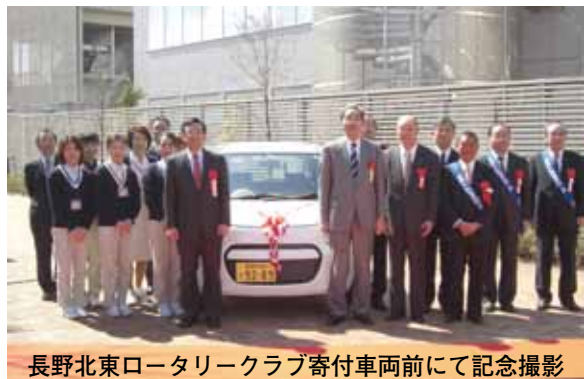
長野北東ロータリークラブ寄付車両前にて記念撮影

平成21年度も、市民の皆様からたくさん暖かい支援をいただきました。本当にありがとうございます。ご寄付いただきました物品は、大切に活用させていただきます。