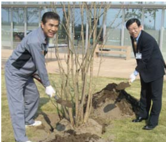
植樹の様子(東日本システム建設株梅野部長と当病院長)