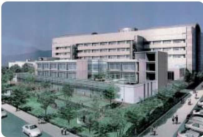
増床後の外観図(病院南側より)

民間感覚を取入れ、全国に先駆けて公設民営方式を採用し、患者サービス(質の高い医療の提供、良い接遇等)に徹する一方、病院事業会計の収支均衡を図り、市民の税金投入をなるべく少なくする経営努力、また投