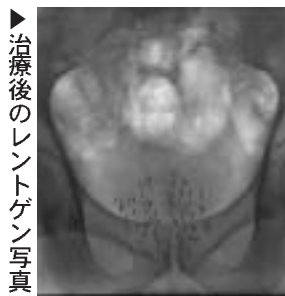
治療後のレントゲン写真

小線源治療とは 麻酔下に会陰(肛門の前の部分)からシャープ本の芯のような線源を前立腺に60-80個くらい打ち込み、体内から放射線を当てる治療法。従来体外から放射線を照射する方法に比べ、治療効果が優れており、合併症が少なくといった特徴を有している。