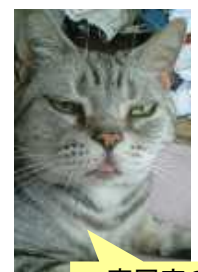
富岡家の キャンディです